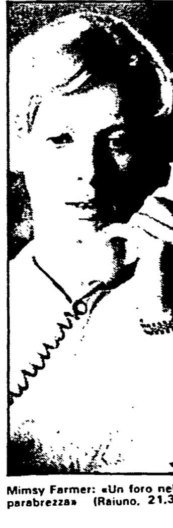
Mimmy Farmer: «Un foro nel parabrezza» (Raiuno, 21.30)