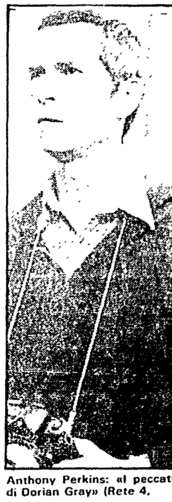
Anthony Perkins: «I peccati di Dorian Gray» (Rete 4).