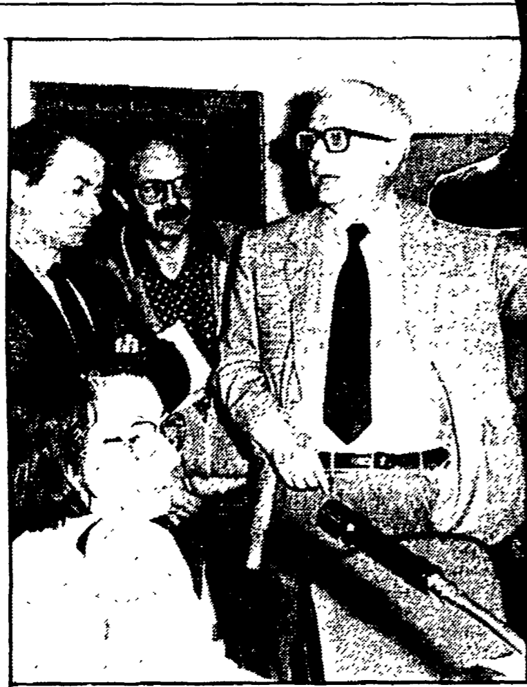
Enzo Biagi tra i suoi collaboratori nella redazione di «Linea diretta»

Finisce stasera un'avventura durata sei mesi. L'avventura televisiva di «Linea diretta». Quando Enzo Biagi mi propone di lavorare con lui, ancor prima di Natale, non ho la minima idea di cosa si tratti. Serviranno i tanti anni di esperienza giornalistica nella «carta stampata», o bisognerà ricominciare da capo? Dovremo fare, spiega Biagi, un programma di mezzora, tutte le sere, per cinque sere la settimana. Scegliere il fatto, l'argomento del giorno più importante, e scavarci dentro: per portarne alla luce i protagonisti, i precedenti, per farne scaturire cause e ragioni. Senza tesi preconcette, senza condizionamento alcuno, con l'idea-forza di lasciare parlare esclusivamente i fatti. Sembra l'Abc del giornalismo, ma solo ad enunciarli, simili concetti suscitano stupore, tensione, allarme. «La rivoluzione di Enzo Biagi» si legge sui settimanali. Siamo così abituati a un'informazione avvolta nelle veline del «Palazzo», che basta poco per far pensare a qualcosa di dirimpente.