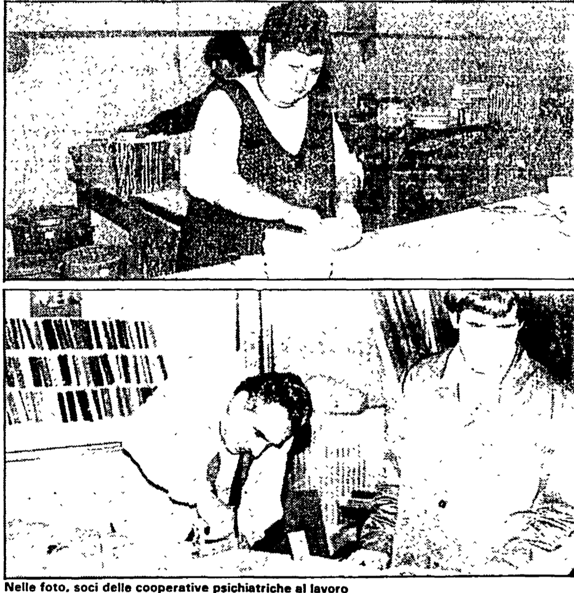
Nelle foto, soci delle cooperative psichiatriche al lavoro

Finora i soldi sono arrivati dal Fondo Sociale Europeo attraverso l'Enaip - Sono state aperte due case-albergo e i malati di mente hanno lavorato in attività artigianali e nella manutenzione dei giardini - Se la Usi non appoggia il nuovo progetto il 30 giugno si chiude