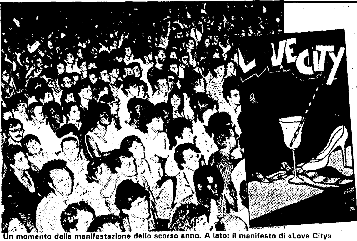
Un momento della manifestazione dello scorso anno. A lato: il manifesto di «Love City»

Tunnel della Peste che da una parte inghiotte per poi restituire (dopo i sedici giorni) negli «inferi» della città. Lì nel Tunnel si potrà assistere ai concerti dei più noti cantautori d'amore italiani (è previsto il ritorno in «grande» di Fred Bongusto), a spettacoli e recite a «Live Love», ovvero conversazioni nel corso delle quali uomini e donne di spettacolo illustre-