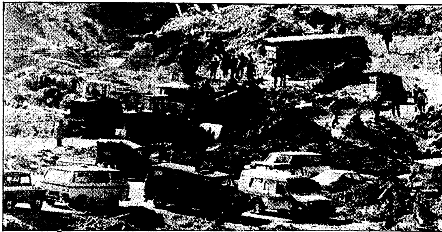
Un ammasso di fango e detriti: l'agghiacciante immagine della Val di Fiemme sconvolta dalla valanga

caluso — che la strage di Cavalese non è dovuta al fatto. Essa è un anello di una catena di disastri che hanno travolto tante vite umane e che trovano origine nelle arretratezze politico-culturali delle vecchie classi dirigenti e in antiche e nuove storture economiche, sociali e amministrative dello Stato italiano».