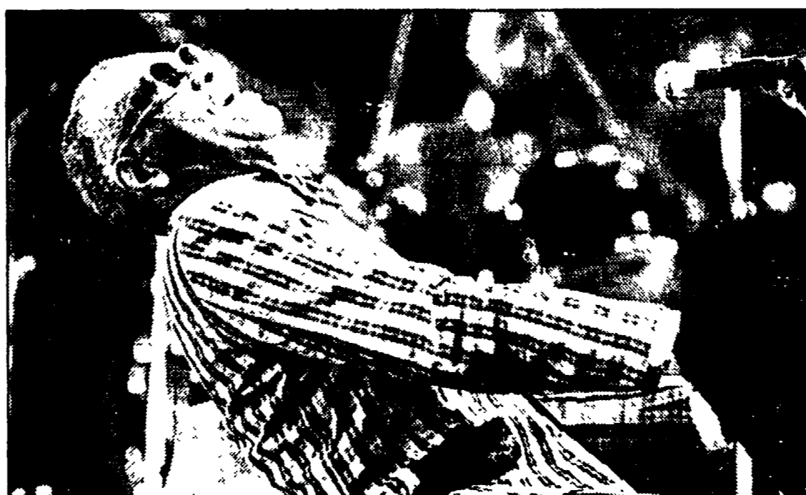
Ray Charles in piena azione. La donna stanca si riposa...

Murales però ha le sue buone ragioni. Primo: Ray Charles ha perentoriamente chiesto che non si includesse nella sua area di concerto, più di 6 microfoni (documento inequivocabile lo dimostra). Secondo: alle ore 20, cioè poco più di un'ora prima del concerto, Amedeo Sorrentino ha ricevuto una ingiunzione del sindaco di Roma nella quale si ordinava una riduzione a 2 decibel sopra il rumore ambientale dell'impianto di amplificazione. La richiesta era prevedibile, dopo le polemiche degli abitanti della zona su «rumori» musicali. «Dove non è arrivata forse qualche nota — dice un comunicato di «Ballo. Non solo...» — è senz'altro arrivata la carica di magnilismo e suggestione che solo un artista come lui sa trasmettere». OK. Resta.