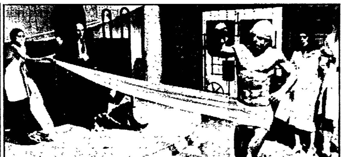
Scena di «The Rocky Horror Picture Show» stasera al cinema Vittoria

● REPLICHE nei teatri romani degli spettacoli di Firenze Fiorentini (Giardino degli Aranci) di Sergio Ammirata (Antiteatro Quercia del Tasso), della compagnia dell'Ombrello (Villa Aldobrandini) del Gran teatro (Uccellieri) e di Attilio Marangon (Convento Occupato). ● TEATRO ROMANO DI OSTIA ANTICA Ore 21 «Comœdia» di Plauto di Ghigo De Chiara. L. 15.000 rid. L. 10.000. Il teatro si può raggiungere anche in barca, partendo alle ore 19 da Ponte Marconi con la motonave «Iber 1». Dopo lo spettacolo ritorno in pullman. Prezzo L. 10.000. ● MUSEO DEL FOLKLORE. P.zza S. Egidio. Ore 21 «Convento amoroso» di Piera Angelini, regia di Renata Zamengo. ● FONDI. V Festival del Teatro Italiano. Ore 21.30 «Parigi è sempre Parigi». Scherzo per attore, pianoforte e donna in nero di Antonio Francioni e Aldo Nicolaj. Regia di Flavio Andreini. Allestito dal «Teatro della Tosse». Protagonista dello spettacolo è un attore, dal passato brillante, in attesa di una prossima scrittura e diviso fra ricordi e sogni, in situazioni che si alternano tra stati di euforia e momenti di depressione.