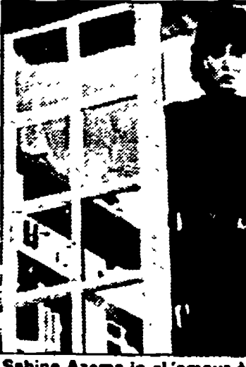
Sabine Azema in «L'amour à mort» di Resnais