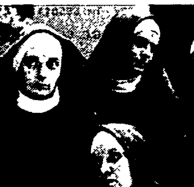
Una scena di «Il convento amoroso»

● SOTTO LE STELLE, ma oggi dalle 16.30 al tramonto anche sotto... il sole. Sarà infatti possibile, grazie ai telescopi installati dall'Associazione Romana Astrofili, osservare da vicino l'astro «di fuoco». Dopo questa folgorante perlestrazione, dalle ore 21 alle ore 24, verranno proiettate diapositive su Giove il Pianeta gassoso, il film Apollo 15 Su monti della Luna (Usa), il film Apollo 17 Sulle spalle dei giganti (Usa). Per finire la serata una descrizione delle Costellazioni visibili nel cielo di Roma in quel momento. Di particolare interesse i filmati, concessi dall'Usis dell'Ambasciata americana, che rappresentano la documentazione di una decisiva tappa della storia dell'Uomo nella conquista dello Spazio.