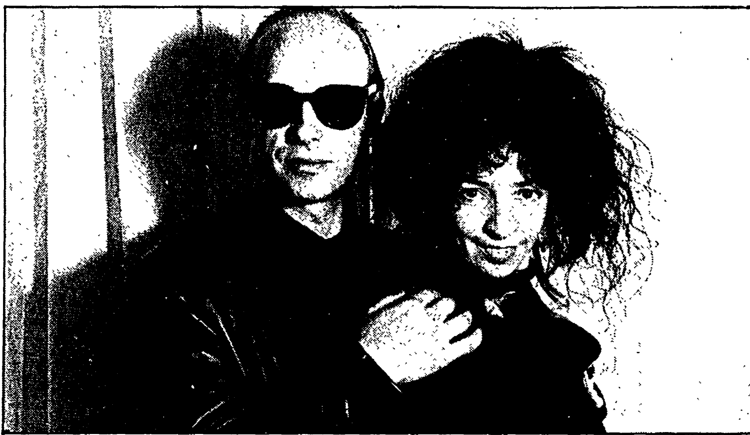
Teresa De Sio con Brian Eno, che ha collaborato al suo nuovo album «Africana»