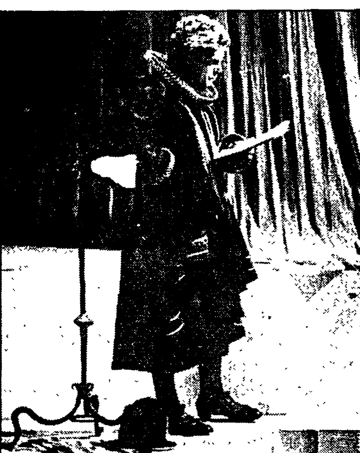
Michele Placido in una scena di «Il moro di Venezia»