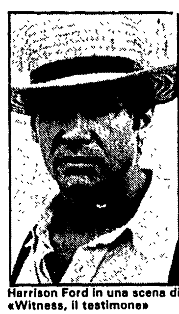
Harrison Ford in una scena di «Witness, il testimone»

Per quanto concerne il 1985, positivi nel complesso i dati del primo semestre: rispetto al 1984 si è avuto il 2,7% di spettatori e l'8,5% di incassi in più. Un quarto di spettatori in più rispetto all'anno scorso si sono avuti nel mese di giugno per un totale di circa 800.000, con un incasso di oltre 4 miliardi. Secondo le rilevazioni del centro di elaborazione dati dell'Agis, l'andamento più favorevole di giugno '85 rispetto all'84 è principalmente imputabile all'uscita di film importanti all'inizio del periodo estivo.