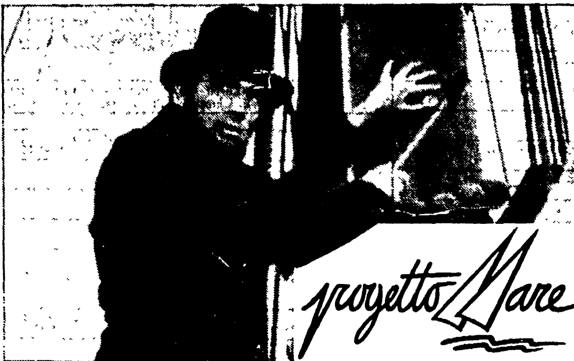
Gregory Peck in «Moby Dick» di John Huston del 1956

colosso «Moby Dick» di John Huston per finire con la profeta catastrofica de «L'ultima onda» dell'australiano Peter Weir, sulla fine del mondo causata da un maremoto. Tra i film in programma: «007 mai dire mai», «Carmen Story», «Il navigatore», «Koyaanisqatsi», «Aguirre furore di Dio». Il mare è anche uno dei soggetti preferiti dalla fotografia, non mancherà quindi una multimediate dedicata alle più belle