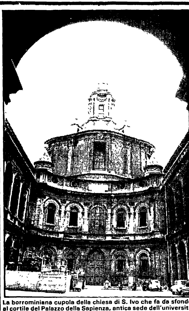
La borromiana cupola della chiesa di S. Ivo che fa da sfondo al cortile del Palazzo della Sapienza, antica sede dell'università

Cosa farò da grande? Questo dilemma si presenta in modo più concreto al momento della scelta del corso di studi universitari. Le iscrizioni si sono aperte l'altro ieri e non ci sono più di tre mesi per prendere una decisione tra le più importanti nella vita di un giovane. Seguire gli interessi di studio oppure orientare la propria scelta a seconda delle prospettive di lavoro? Purtroppo oggi i due momenti raramente coincidono.