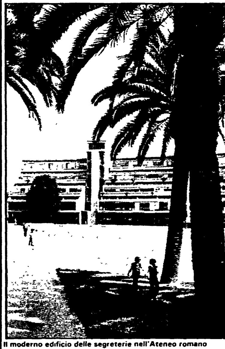
Il moderno edificio delle segreterie nell'Ateneo romano