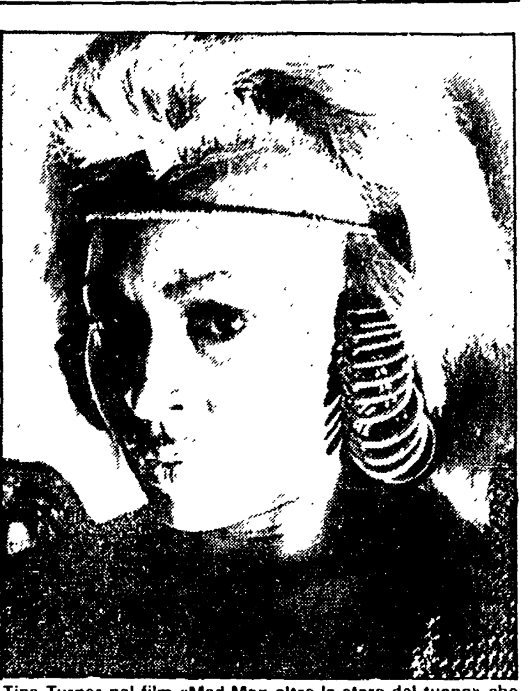
Tina Turner nel film «Mad Max oltre la sfera del tuono» che sarà presentato alla Mostra di Venezia