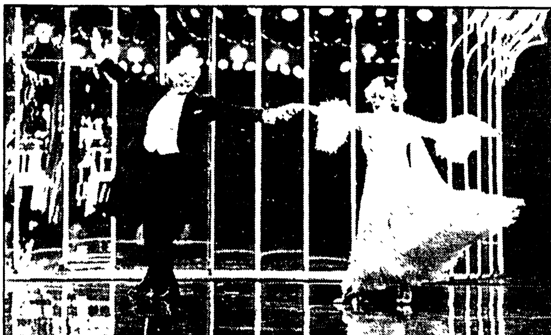
La «scena madre» del film di Fellini «Ginger e Fred»

edilizia sembrano architettare cento emozioni umane in un tutt'uno che la gente che vi abita e la conseguente azione scenica? Il neo-realismo di Zavattini e De Sica (Ladri di biciclette, Sciusecchia ecc.), di Rossellini (Roma città aperta), di Fellini (La dolce vita, Le notti di Cabiria ecc.) sono capitoli antologici romani che hanno fatto da guida, o portato al successo il Cinema in tutto il mondo. «U Mamma lo vedi? Com'è tutto