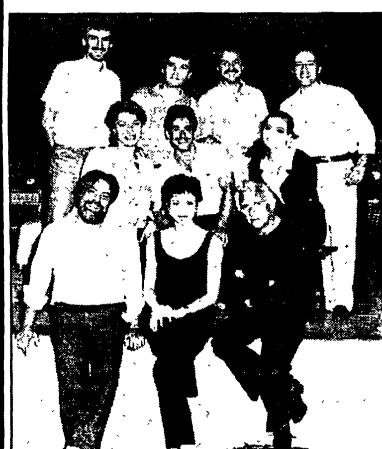
La Compagnia del Teatro alla Ringhiera in «L'eunuco»

● PROGETTO MARE — Lungotevere della Vittoria. CINEMA: ore 21: «Il sorpasso» di Dino Ris; ore 24: «La palla n. 13» di Buster Keaton. VIDEO: ore 22: «I migliori surfers del mondo» di Yuri Farrant; «Hawaii tant qu'il y aura des vagues» di Thalassa; «Sharing the wind» di R.P. Allen; «Hawaii vento e onde» di Ugo Murgia Editore. Dalle 20.30 alle 22 e dalle 24 in poi rassegna video. DISCOTECA: inizio ore 22.30 a cura di Marco Sacchetti e Francesca Micheli.