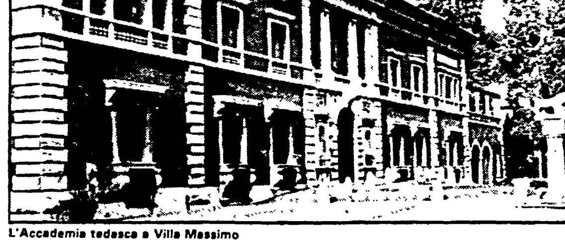
L'Accademia tedesca a Villa Massimo

● MUSICA DI TESTACCIO La Scuola popolare di musica di Testaccio apre le iscrizioni per l'anno scolastico 1985-86 a partire dal 2 settembre (orario di segreteria 16-20) presso i locali della scuola in via Galvani, 20 - Tel. 5757940. La scuola mette a disposizione dei soci corsi di strumento e laboratori tecnici e pratici: una biblioteca musicale con servizio consultazione e prestiti; uno spazio di incontro-confronto tra insegnanti, allievi, operatori ed amanti della musica in genere. Sono previsti durante l'anno concerti, seminari, conferenze ed incontri per una maggiore conoscenza e diffusione della musica.