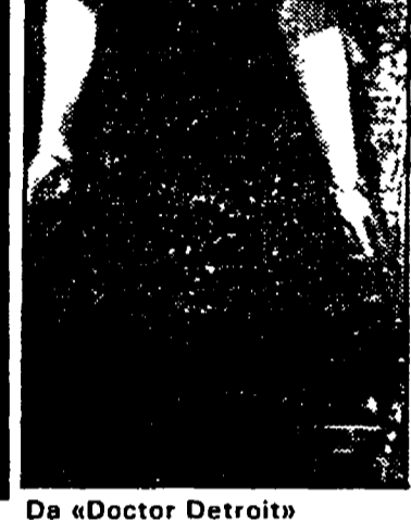
Da «Doctor Detroit»