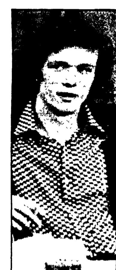
Da «Matti da slegare»

● AZZURRO SCIPIONI (Via degli Scipioni, 84 - Metro Ottaviano). Ingresso L. 3.500 gelato incluso. Ore 16.30 «Attori di provincia» di A. Holland; ore 18.30 «Lo specchio» di A. Tarkowski; ore 20.30 «Oblomova» di N. Michalkov; ore 22.30 «Schiava d'amore» di N. Michalkov. DOMANI: ore 18.30 «Matti da slegare» di Agosti, Ballochico, Petraglia, Rulli; ore 20.30 «Il Pianeta Azzurro» di F. Piavoli; ore 22 «D'amore si vive» di S. Agosti.