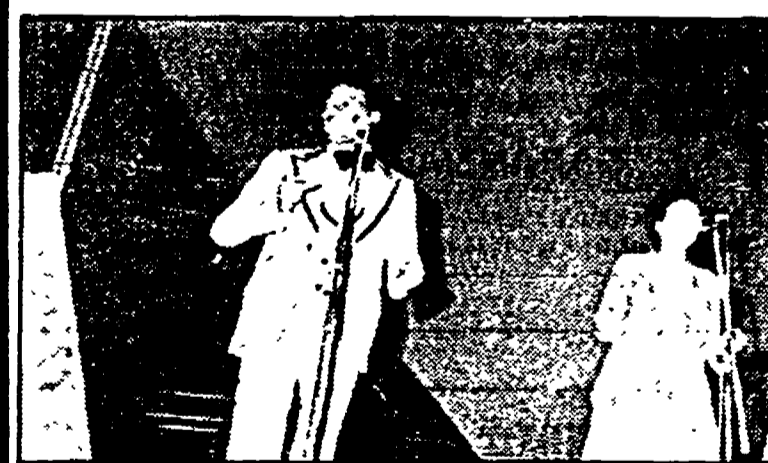
Una recente immagine dei «Platters»