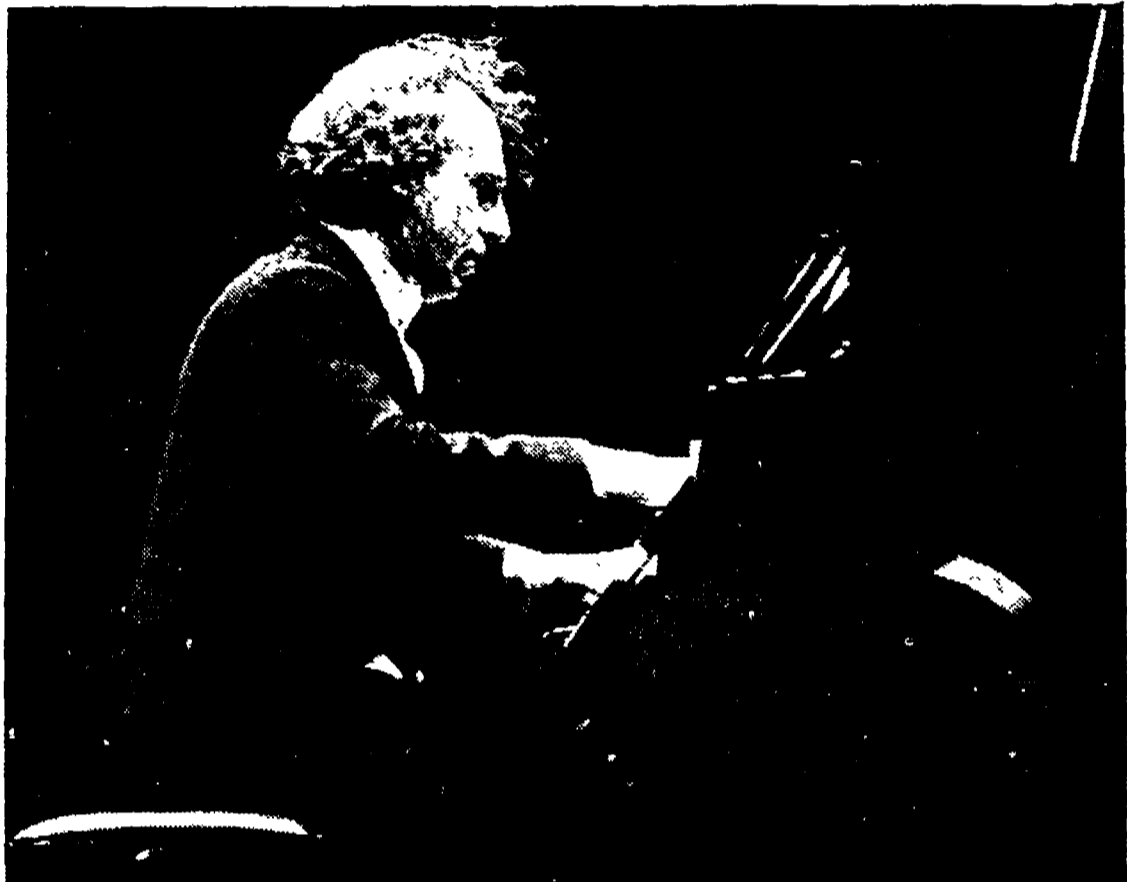
Maurizio Pollini, ha eseguito a Pesaro le ultime sonate di Schubert