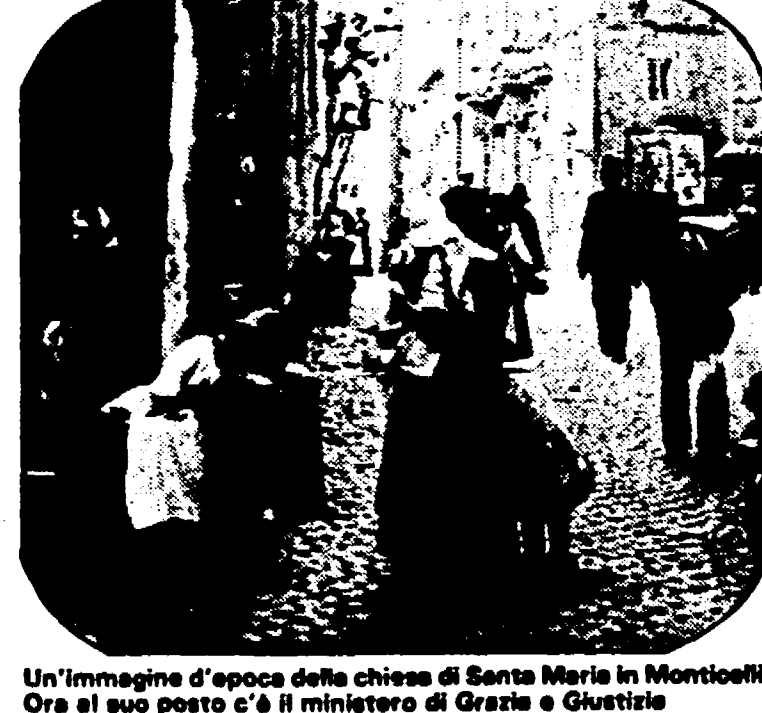
Un'immagine d'epoca della chiesa di Santa Maria in Monticelli. Ora il suo posto c'è il ministero di Grazia e Giustizia

Di sorpresa in sorpresa, tirando fuori da un forziere una ricchezza che non finisce mai, ecco Willy Pociño ricondurreci sull'inesauribile filo d'Arianna de «Le curiosità di Roma» (ed. Newton Compton L.35.000), un libro, che tra le giacenze copiose sullo stesso tema, risulta essere tra i più felici e di saprosa fattura. Roma non basta una vita, come si dice, e per questo diamo atto all'autore, dotato di una certissima e gigantesca pazienza (tutto in ordine alfabetico per la più agevole ricerca), di aver saputo aggiungere a «quello che si sapeva» una larga fetta dello «sconosciuto» di questa città che, attaccata al famoso filo della figlia di Minosse, esce dal labirinto della sua storia. Dalle finestre socchiusse di una fine osservazione (e iron-