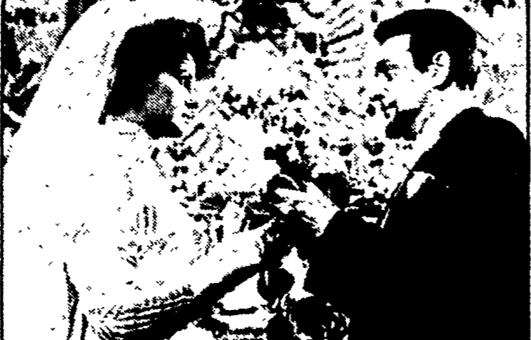
«Mio Dio come sono caduta in basso» (Retequattro, 20.30)

Raiuno 13.00 MARATONA D'ESTATE - Rassegna internazionale di danza 13.30 TELEGIORNALE 13.45 JESSICA - Film, Regia di Jean Negulesco, con Maurice Chevalier, Angela Bouquie