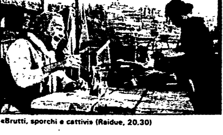
«Brutti, sporchi e cattivi» (Raidue, 20.30)

Raiuno 12.30 MARATONA D'ESTATE - Rassegna internazionale di danza 13.30 TELEGIORNALE 13.45 GLI UOMINI DELLA CITTA' DEI RAGAZZI - Film, regia di Norman Taurog, con Spencer Tracy, Mickey Rooney