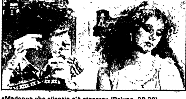
«Madonna che silenzio c'è stasera» (Raiuno, 20.30)

Raiuno 13.00 MARATONA D'ESTATE - Rassegna internazionale di danza 13.30 TELEGIORNALE 13.45 TRE UOMINI IN BARCA - Film, Regia di Ken Annakin, con David Tomlinson, Jimmy Edwards