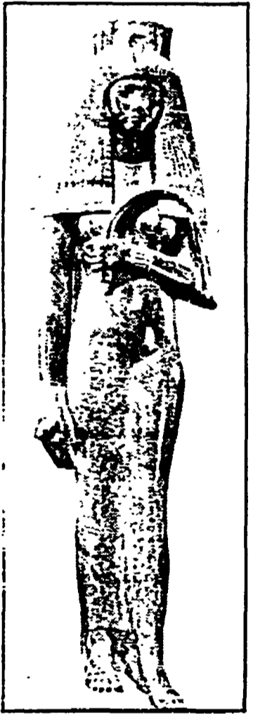
La regina Tuys, madre di Ramsete II