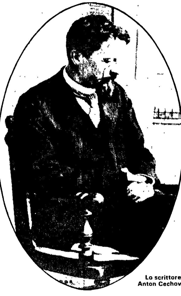
Lo scrittore Anton Chekhov