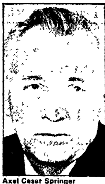
Axel Caesar Springer

ricerca e nella messa a punto di un analogo sistema. Il segretario di Stato ha all'incirca detto al corso di non aver mai accettato una riduzione sostanziale degli armamenti offensivi e di aver anzi potenziato il suo arsenale con armi nucleari di primo colpo... Ma ha anche fatto qualche accenno positivo ricordando che «le superpotenze hanno diviso il conflitto mondiale per quattro decenni e che ci sono stati alcuni successi nel tentativo di limitare la proliferazione nucleare...»