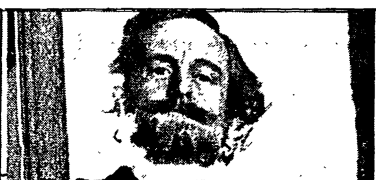
Ronald Pickup: «Verdi» su Raidue alle 20,30