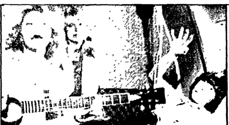
L'aereo più pazzo del mondo (Italia 1, ore 20,30)