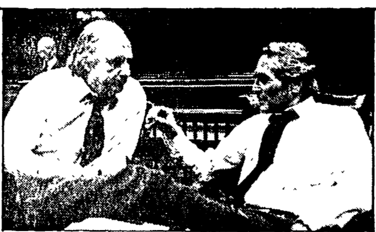
ell verdetto su Raitre ore 20,30