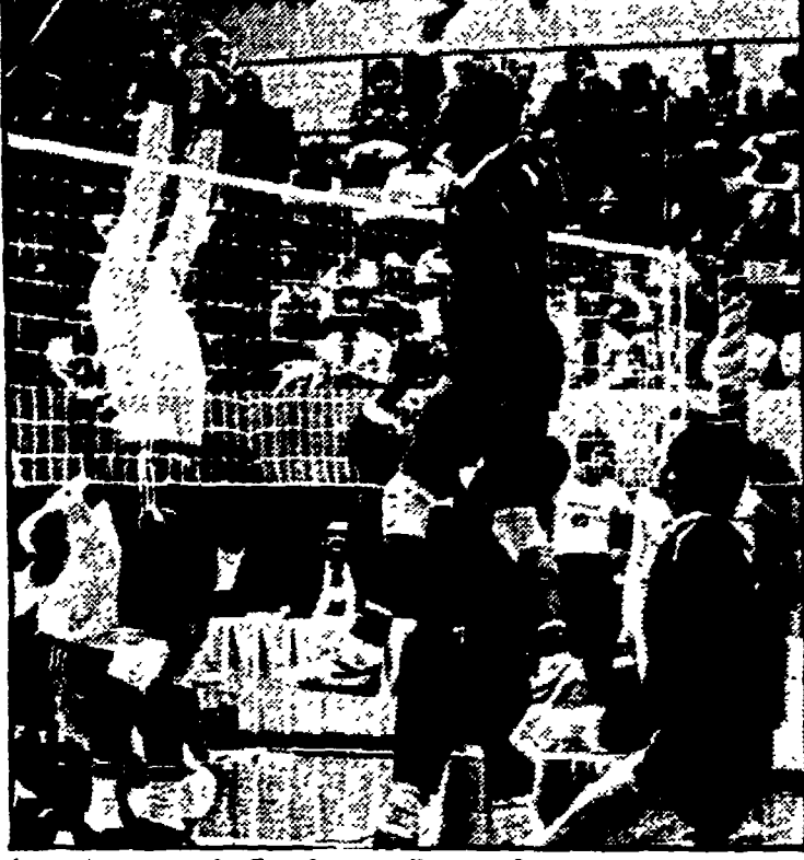
Esordio contro la Grecia per gli azzurri

Nostrum servizio VOORBURG (Amsterdam) - È un'occasione da non gettare alle ortiche: un salto nell'accogliente terra d'Olanda, quella dei tulipani e delle ciogge (per non tradire il più tipico dei quadretti), per confermare anche nel ristretto ambito europeo i progressi, qualcuno parla di «magico momento», del volley azzurro.