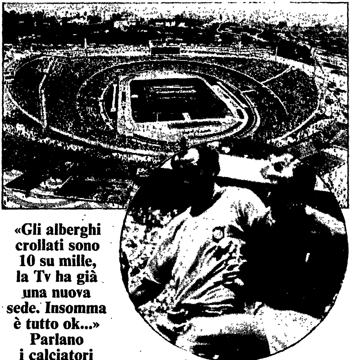
Lo stadio olimpico di Città del Messico e, nel tondo, Mazzola in Italia-Brasile

portamonete a soffietto che si usavano una volta. Quattro ore per riprendere a funzionare, straordinario. Per tirar fuori tutti i suoi morti non sono bastati questi dieci giorni.