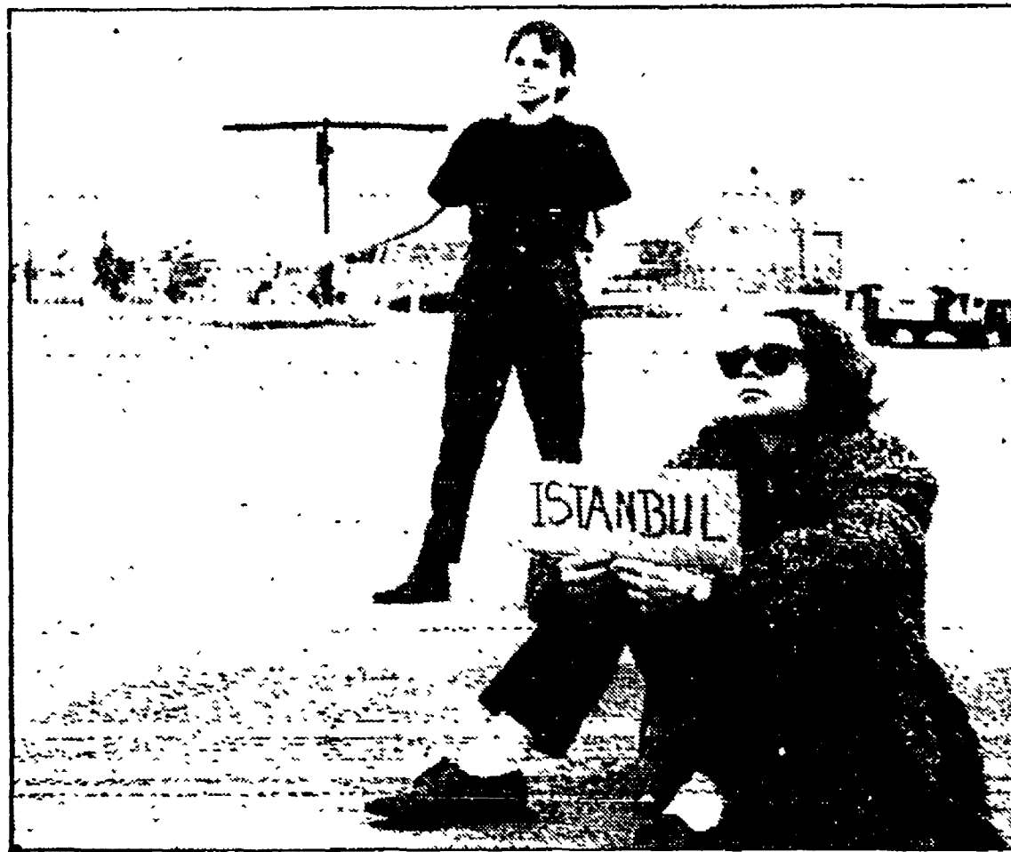
Un'inquadratura di «Istanbul» di Marc Didden e in alto «Marijyn» di Ralph Huettner

origine russo-tedesca. Lyon ci regala della «sua» America un ritratto insieme fresco e amaro, girato nello stile del cinema diretto (camera a mano, suono in presa diretta, interpreti presi dalla vita). L'arte del reportage, o il reportage come arte, fate un po' voi.