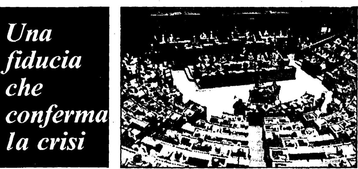
Una fiducia che conferma la crisi

Ciò che Craxi ha detto sulle proposte di Reagan