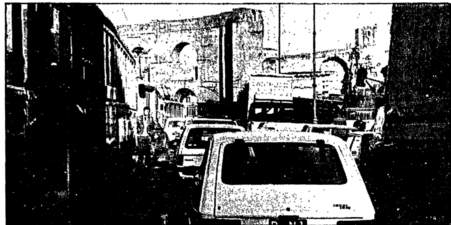
Ingorgo ieri mattina a Porta Maggiore: un dipendente dell'Atac si improvvisa vigile urbano

Una lunga fila di tram fermi, con le porte aperte e abbandonati dal passeggero. Tutt'intorno centinaia di auto, intrappolate da un pauroso ingorgo. Qualche passante divertito che guarda i «poveri» automobilisti. Neanche un vigile nel raggio di chilometri. La scena si poteva osservare ieri mattina per ore in piazza di Porta Maggiore. Ma la paralisi è stata sfiorata decine di volte in molti punti della città. E oggi probabilmente sarà ancora peggio. I vigili urbani da questa mattina hanno sospeso gli straordinari, indispensabili per fronteggiare il traffico cittadino. La tensione è il nervosismo, che da qualche giorno serpeggiano nella categoria, si sono trasformati in una vera e propria giornata di «agitazioni». Già ieri qualche gruppo ha abbandonato gli incroci e s'è riunito in assemblee spontanee. Oggi le organizzazioni sindacali hanno indetto riunioni in tutte le zone della città che forse confluiranno in un'assemblea di migliaia di persone al comando generale. Al centro delle discussioni la «sorpresa» ricevuta insieme alla busta paga di questo mese. Decurtazioni dal mezzo milione in su per migliaia e migliaia di dipendenti comunali, ed in particolare per i vigili.