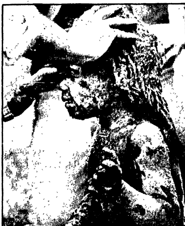
ARMERO — Un soccorritore cerca di togliere il fango dagli occhi di una bambina

BOGOTÁ — Centinai di genitori, sopravvissuti alla tragedia di Bogotá, sono alla disperata ricerca dei propri piccoli.