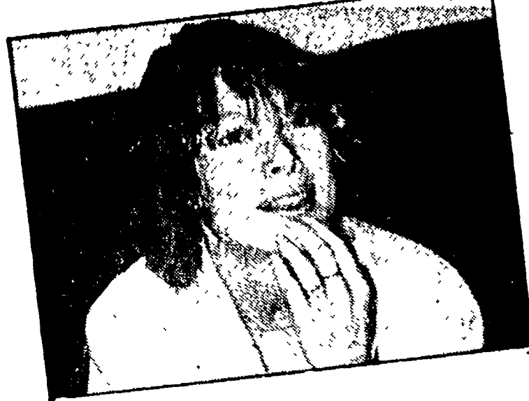
Cinema Nei film americani è il gran momento delle attrici Lange, Streep, Fonda: ecco una «mappa» del divismo femminile