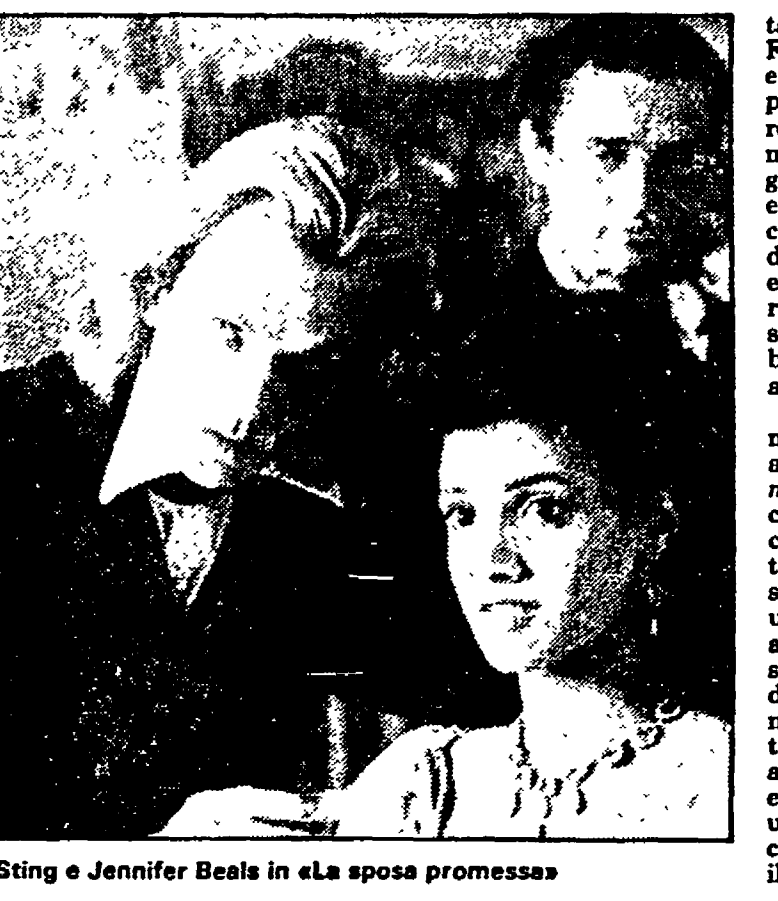
Sting e Jennifer Beals in «La sposa promessa»