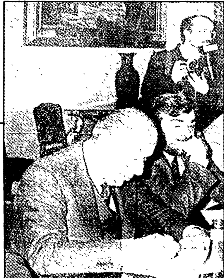
ROMA - Il ministro delle Finanze Visentini ed il ministro del Tesoro Gorla al Consiglio dei ministri