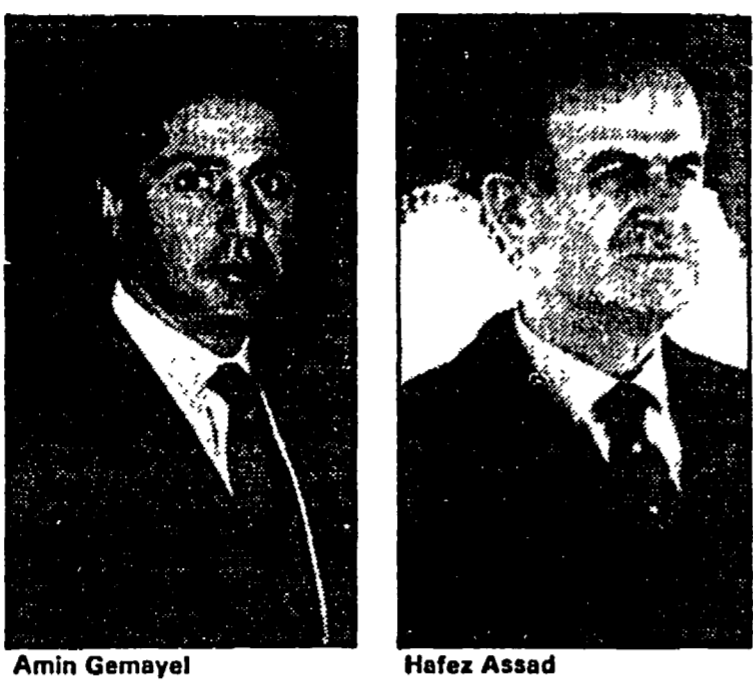
Amin Gemayel Hafez Assad