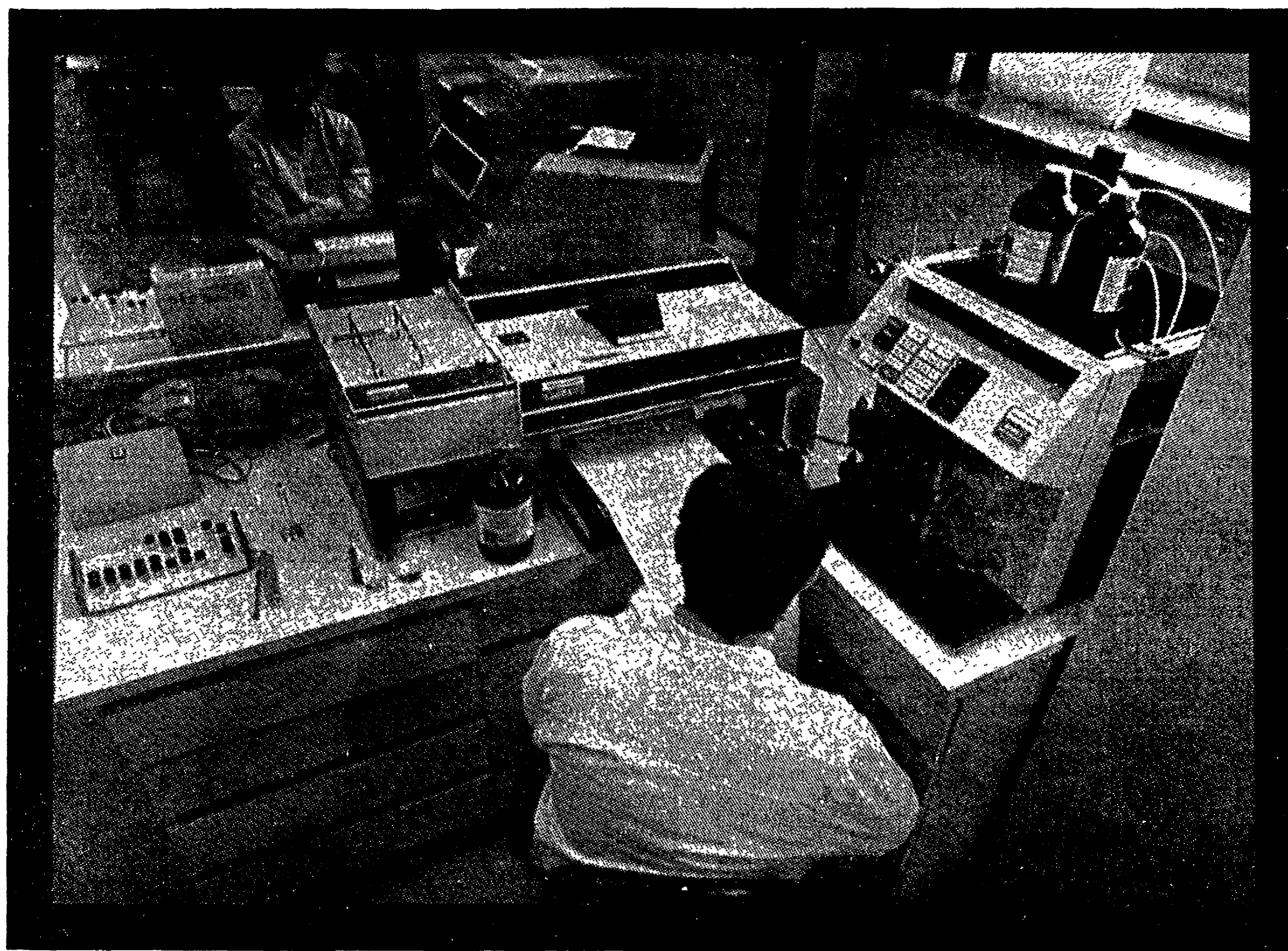
Laboratori di farmacocinetica e chimica metabolica (particolare).

360 ricercatori, in stretta collaborazione interdisciplinare nei centri di ricerca di Firenze,