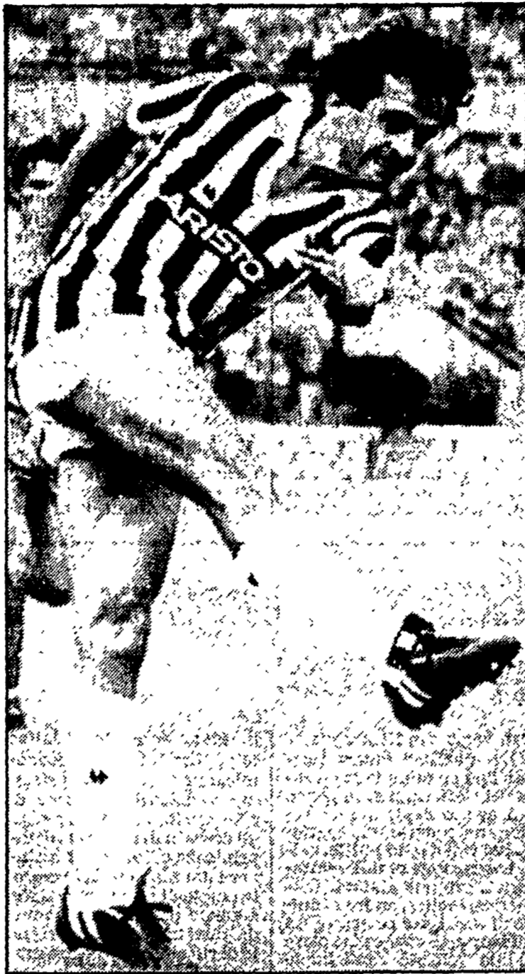
g. pi. Platini ancora per un anno calcerà in bianconero

opzione per il successivo a favore della Juve), oppure sul costo di quella firma in fondo al contratto, silenzi ufficiali e molti mormorii. Ma oggi se ne dovrebbe sapere di più. Si è concluso così un capitolo della storia del calcio parlato nazionale che si trascinava dalle ultime settimane dello scorso anno. In questo periodo è stato detto tutto ed il contrario di tutto arrivando a definire l'intera vicenda un «giallo». E per Platini erano state confezionate soluzioni di tutte i tipi: dal passaggio al Barcellona al Sivette, una vera oasi dorata e disintossicante dai veleni del nostro calcio. Poi era stato il turno di Berlusconi, della sua Tv in Francia e del Milan. In quelle occasioni Boniperti si limitava a poche battute: «Lasciate che dicano, noi siamo tranquilli. Forse tranquillo non era, comunque, anche questa volta, ce l'ha fatta».