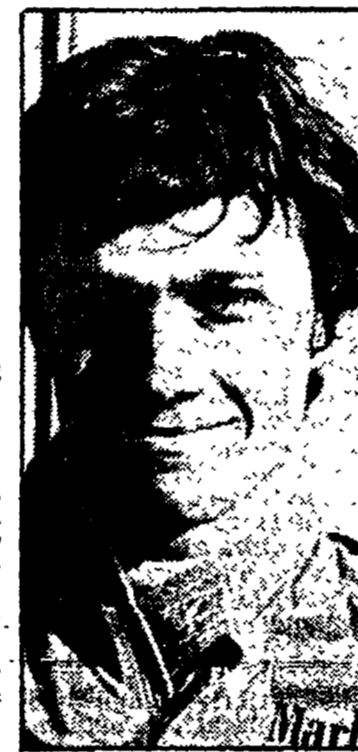
Andrea De Cesaris

MODENA — A meno di improbabili sorprese dell'ultima ora, questa mattina sulla pista della Ferrari a Fiorano Andrea De Cesaris salirà sulla Minardi della quale sarà prima guida per la stagione di F1 che va ad iniziare. Il «matrimonio» fra il pilota romano e la scuderia faentina giunge al termine di un lungo tira e molla dovuto al fatto che l'ex guida della Ligier ha sperato fino all'ultimo di salire a bordo della Benetton per la quale sono invece rimasti in lizza solo l'austriaco Berger e l'italiano Cheever. La scelta verrà effettuata entro la prossima settimana, dal momento che le scuderie hanno tempo fino al 15 febbraio per ufficializzare alla Fisa i nomi dei loro piloti. Di certo si sa comunque che la seconda Minardi verrà affidata ad Alessandro Nannini. Le altre due scuderie che devono ancora definire la scelta dei piloti sono la Tyrrel e la Osella. Sulla monoposto inglese, che ha già Brundle, dovrebbe salire Warwick, mentre per la Osella, che ha già prenotato Capelli, sono in ballottaggio Ghinzani, Baldi, Rothgatter, Larzari e Streiff. Domani la Ligier annuncerà ufficialmente l'ingaggio di René Arnoux.