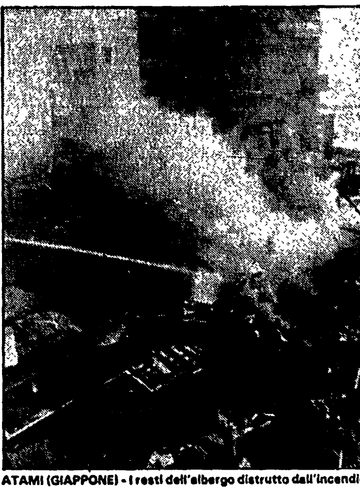
ATAMI (GIAPPONE) - I resti dell'albergo distrutto dall'incendio

TOKYO — Diciannove morti e cinque dispersi sono il bilancio, ancora provvisorio, di un incendio che nel cuore della notte ha distrutto un albergo in legno di tre piani, il Daijokan di Atagawa, a 130 km da Tokyo. Le fiamme sono divampate subito con una tale violenza da ostacolare notevolmente l'intervento dei vigili del fuoco. Le fiamme hanno ridotto le vittime in condizioni tali da renderle irriconoscibili, ma le autorità hanno precisato che fra di loro non ci sono stranieri. Una trentina di clienti sono comunque riusciti a salvarsi. Si tratta del più grave incendio che sia avvenuto in Giappone dopo quello dell'8 febbraio del 1982 che causò la morte di 32 persone, clienti e dipendenti del New Japan Hotel della capitale. Si ritiene che le fiamme si siano sprigionate nella sala giochi del primo piano dell'albergo che è stato costruito nel 1935.