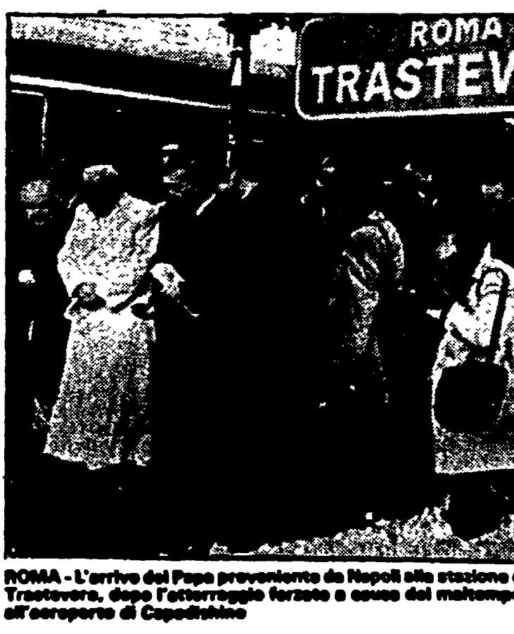
ROMA - L'arrivo del Papa proveniente da Napoli alla stazione di Trastevere, dopo l'atterraggio forzato a causa del maltempo, all'aeroporto di Capodichino