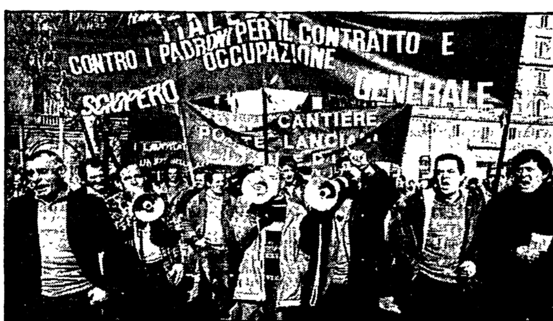
Gli edili in corteo in centro