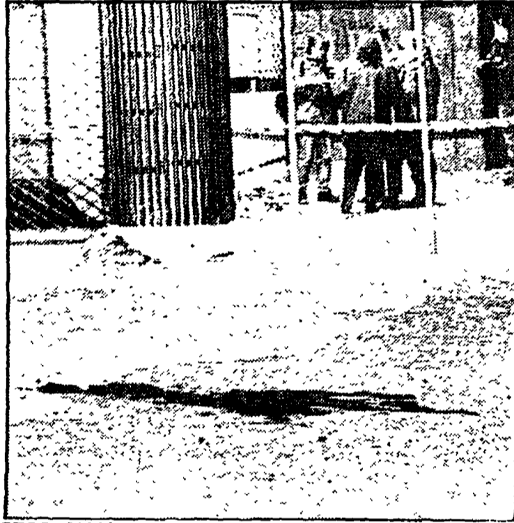
STOCOLMA - Il luogo dove l'altra sera è stato ucciso Olof Palme. IN ALTO: il premier con la moglie e i figli