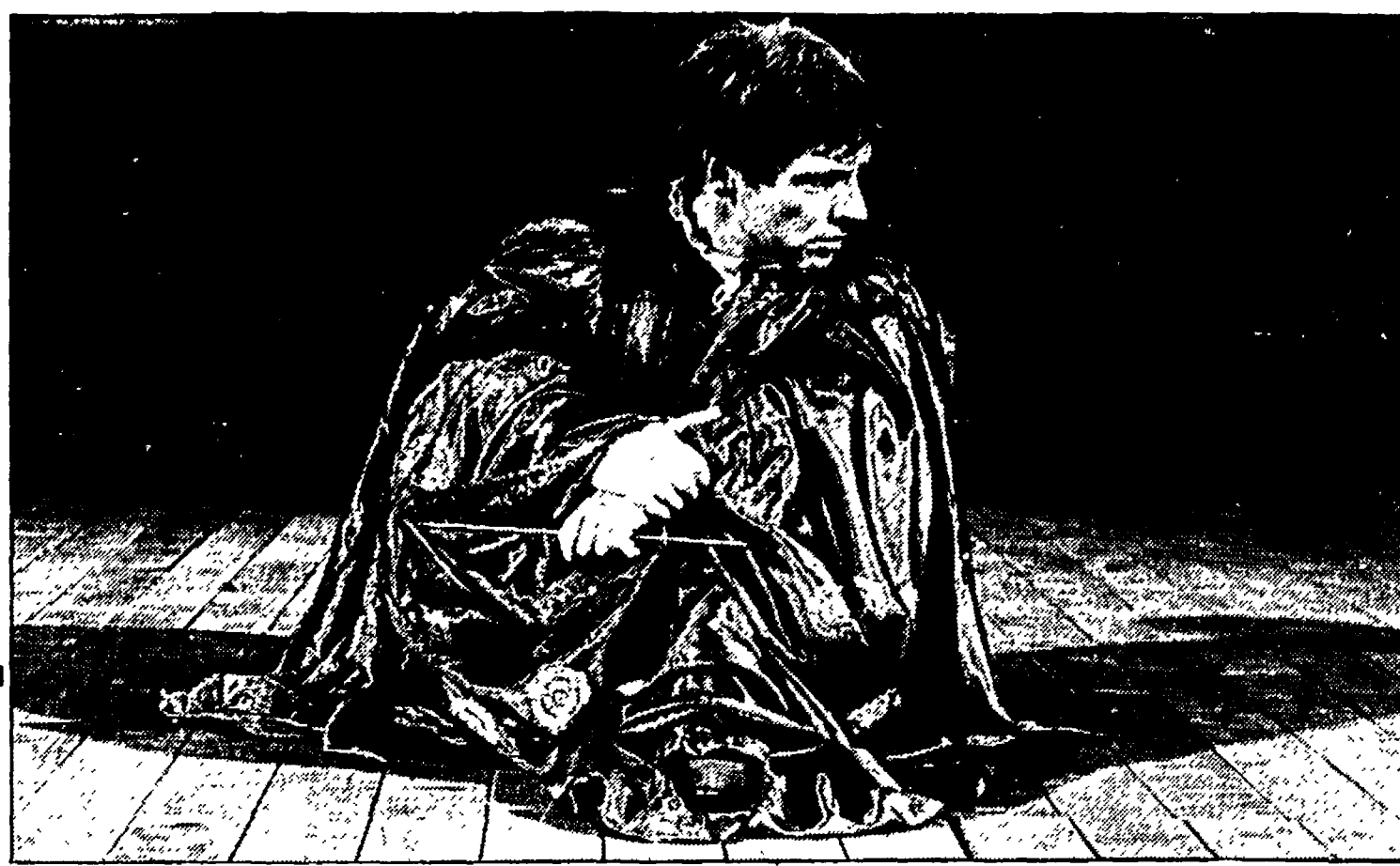
Carlo Cecchi in una scena della «Tempesta»