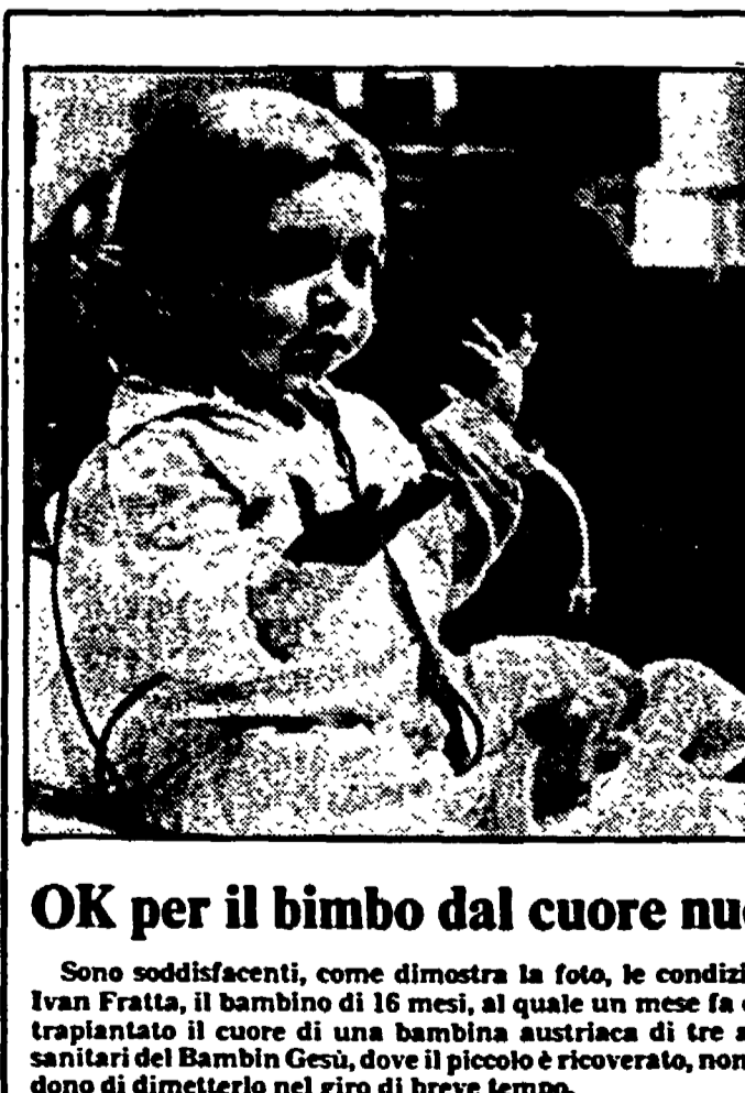
OK per il bimbo dal cuore nuovo