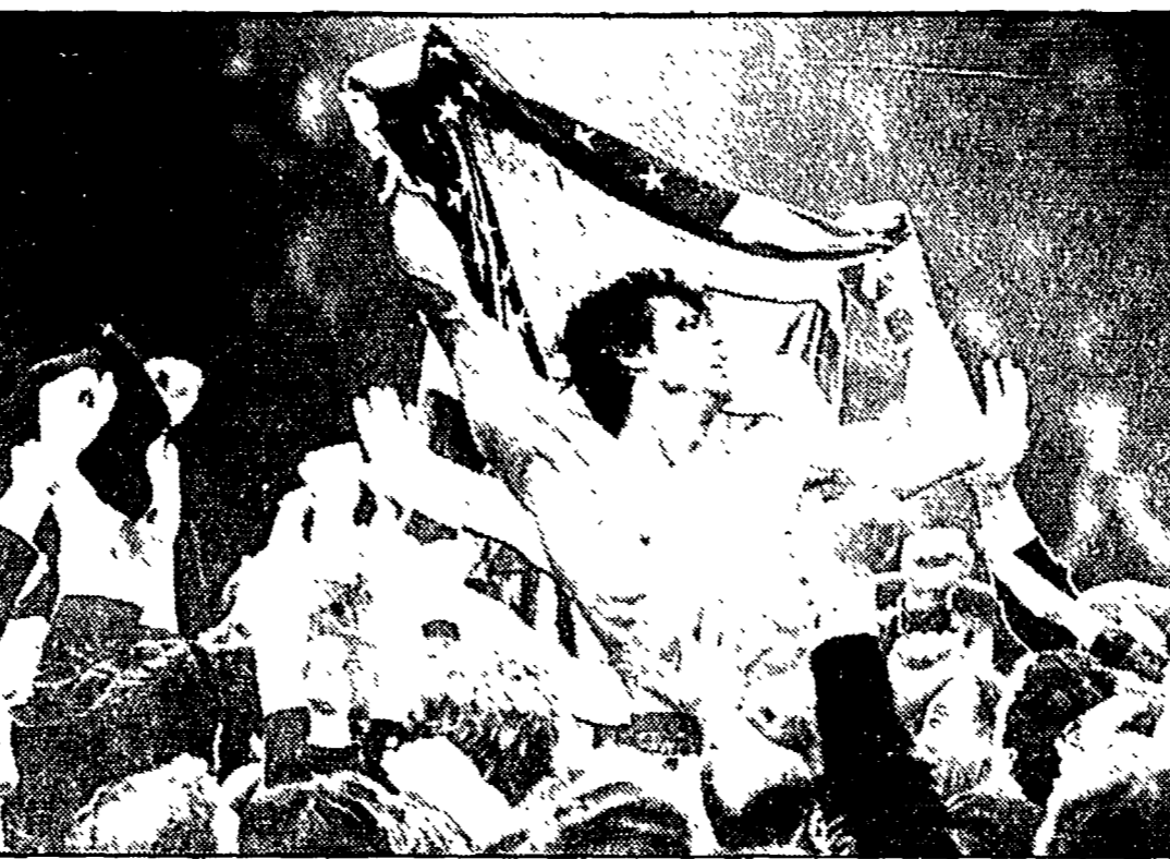
Sylvester Stallone in «Rocky IV». Sotto, un'immagine del film «Cocoon»

Rocky IV, i due supercampioni d'incasso interpretati da Sylvester Stallone. Né è mancato l'antagonista Commando con l'ex Mister Universo Arnold Schwarzenegger, mentre qualche settimana fa sembra che fosse Cocoon uno dei titoli a riscuotere maggior attenzione.