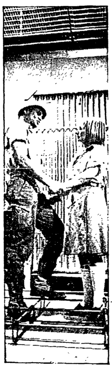
Due scene di spettacoli del Gruppo della Rocca. Qui sopra, «Negro contro nero», in alto «La missione»