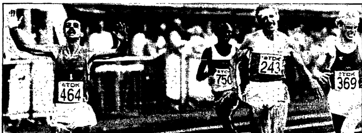
Lo sprint vincente di Cova ad Helsinki '83. Riconoscibile il finlandese Vainio, squalificato per doping dopo le Olimpiadi di Los Angeles