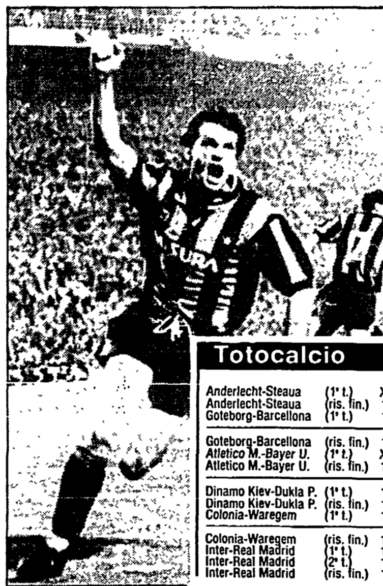
Tardelli esulta dopo aver segnato il primo gol

MARCATORI: al 1° e al 54' Tardelli; all'87' Valdano, all'88' Salguero (autorete).