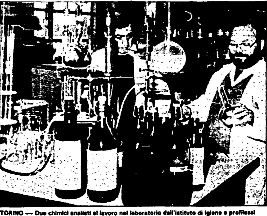
TORINO — Due chimici analisti al lavoro nel laboratorio dell'istituto di igiene e professo-

ti dell'alcool metilico. «È presumibile. Ma sta di fatto che la decisione del 1984 ha dato il via alla più criminale delle sofisticazioni. Torniamo agli effetti sull'organismo umano. L'antico «spirito di legno» — spiega Zanardi — non si comporta come lo spirito d'uva. L'alcool metilico ha infatti una velocità di metabolizzazione (cioè di trasformazione all'interno dell'organismo) nel nostro corpo, il metanolo si accumula. Ecco perché nel grande laboratorio chimico che è il fegato e viene trasformato in due sostanze responsabili degli effetti più gravi: l'alcool formico e l'aldeide formica. Basti pensare che sciogliendo l'aldeide formica nell'acqua, in una soluzione al quaranta per cento, si ottiene la comune formalina, impiegata nei laboratori di anatomia patologica per conservare parti di cadavere. I primi guai cominciano quindi nel fegato provocan-