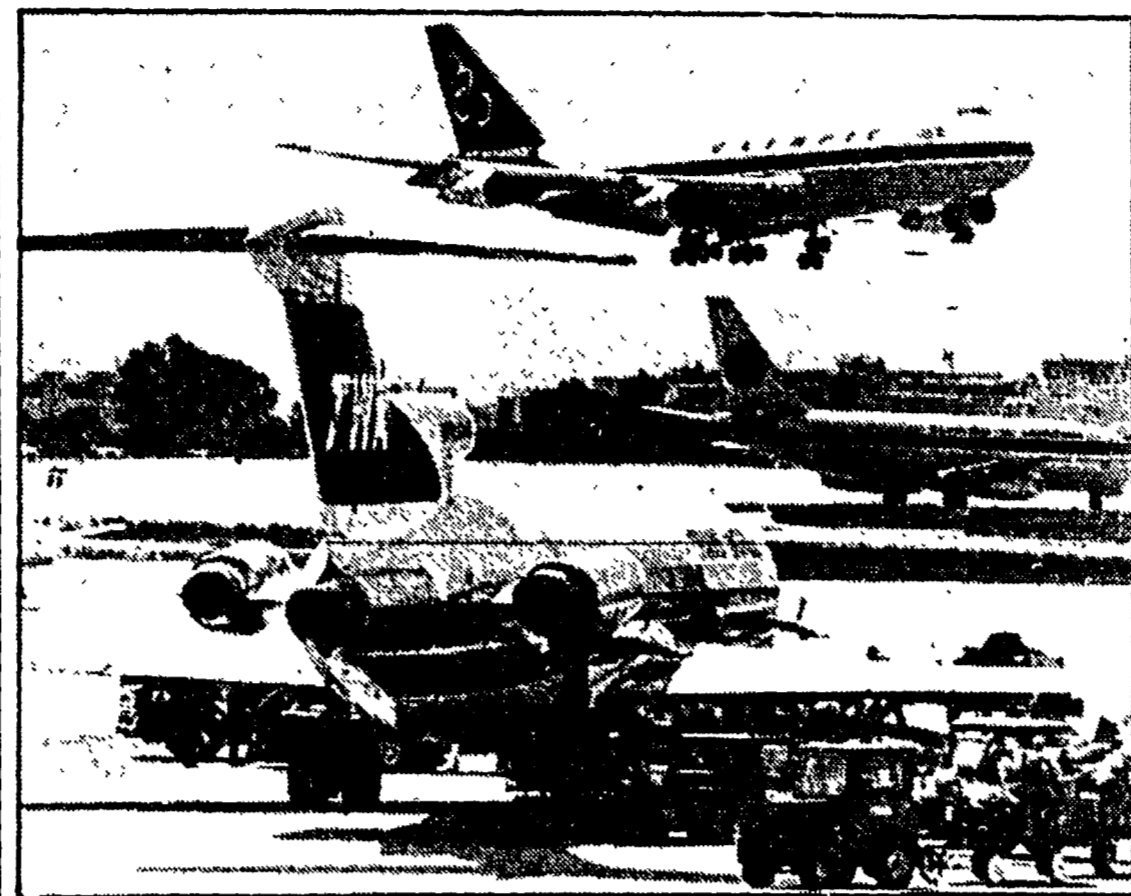
ATENE - L'aereo americano fermo sulla pista dell'aeroporto greco