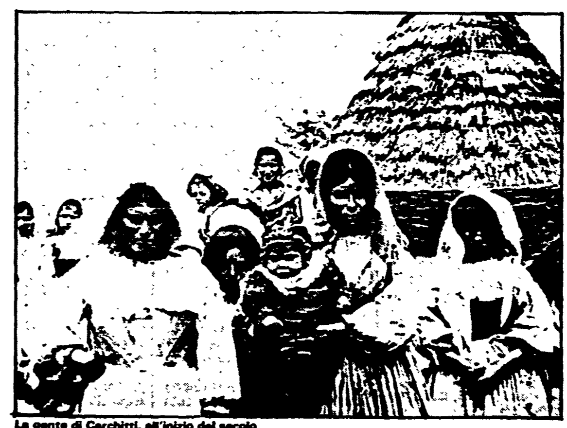
La gente di Carchitti, all'inizio del secolo