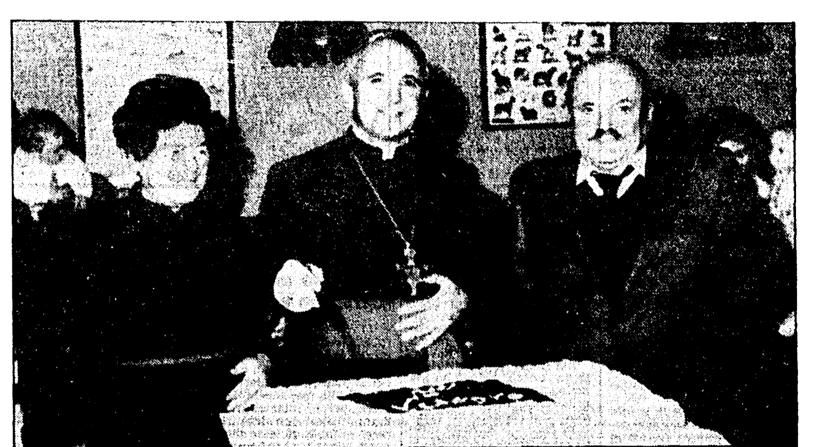
VERONA - Mons. Martinelli in una recente foto con i genitori

ROMA - Nella già terribilissima situazione dei rapporti con la Libia, l'arresto del vescovo italiano Giovanni Martinelli, e di altri religiosi, fra cui una suora italiana, costituisce un ulteriore elemento di preoccupazione.