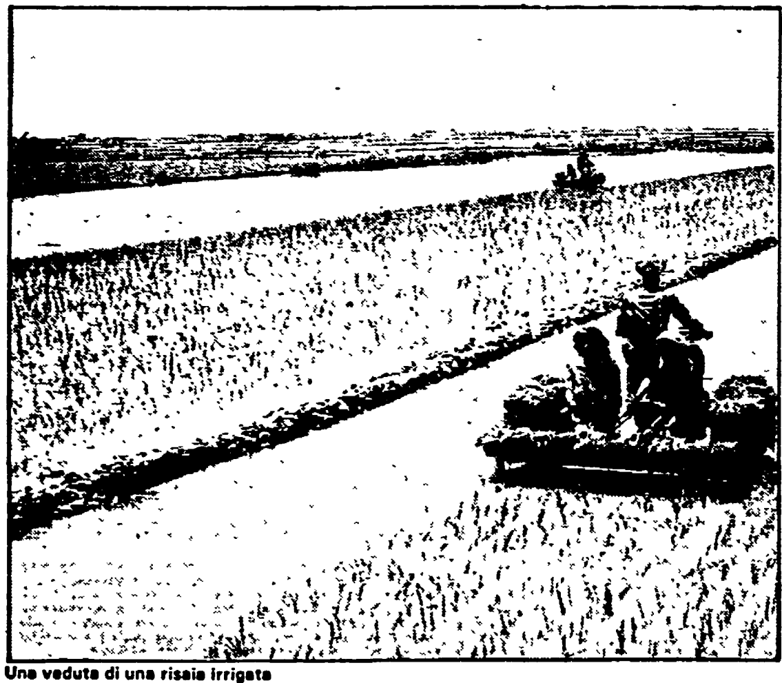
Una veduta di una risaia irrigata

Ma mi lasci dire una battuta amara: se continua così, fra un po' i diserbanti non occorrerà più comperarli, perché i nostri riscoltori potranno irrorare le risale con l'acqua dei pozzi. E ancora una battuta, le dicevo, ma nasce dalla constatazione oggettiva di un inquinamento veramente elevatissimo.