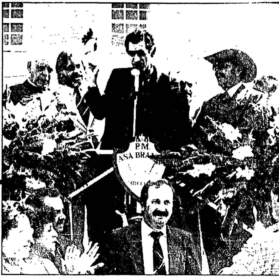
A fianco e in basso delle scene della nuova telenovela brasiliana «Roque Santeiro»

Ma «questa possibilità allo stato attuale è ancora in gran parte teorica: l'informazione diventa il primo potere in assoluto a disposizione di comunità tecnocraticamente efficienti».