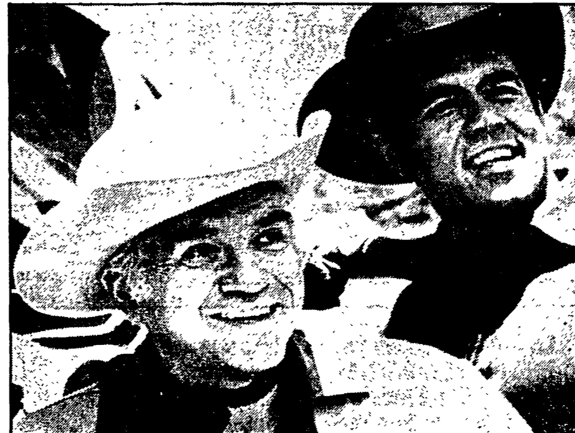
Un'inquadratura del celebre telefilm «Bonanza»