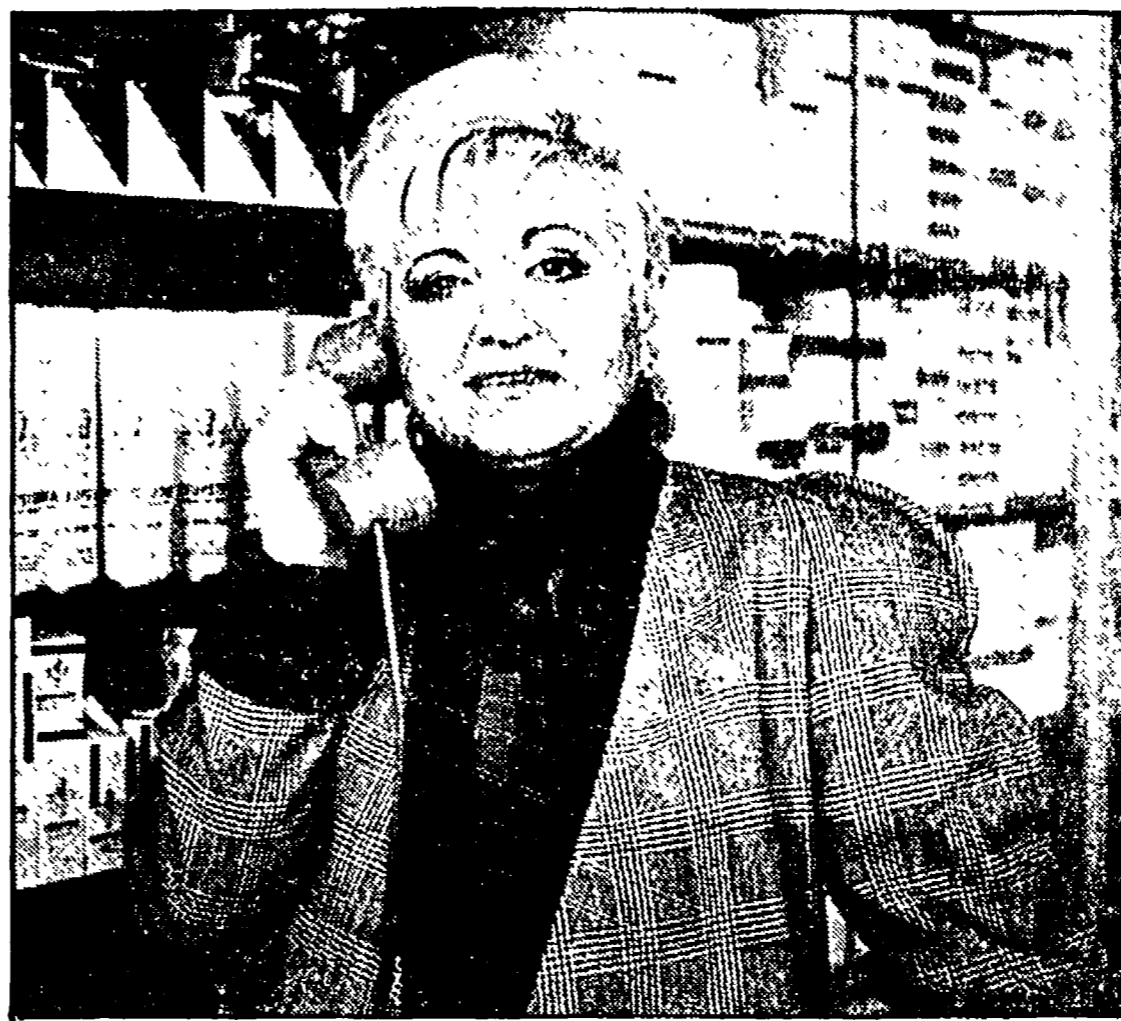
Vanna Marchi conduttrice di una delle più note aste televisive