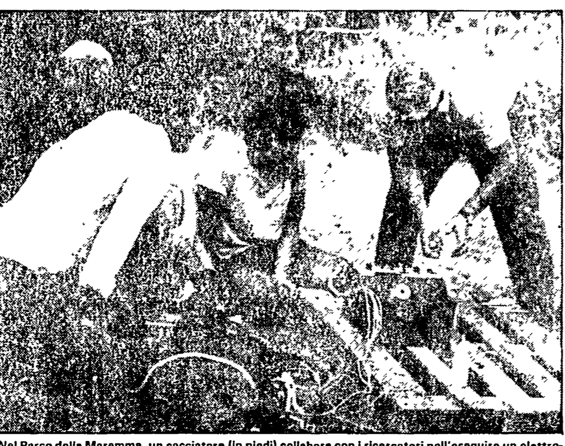
Nel Parco della Maremma, un cacciatore (in piedi) collabora con i ricercatori nell'eseguire un elettrocardiogramma a un cinghiale anestetizzato.

PARIGI (18-10-1950). Protezione degli uccelli. Modifica della convenzione di Parigi del 1902.