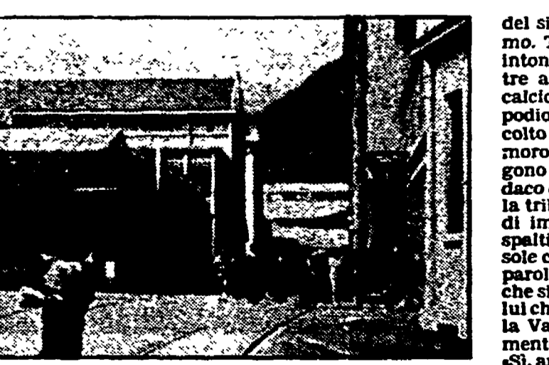
Valdagno: interno degli stabilimenti Marzotto, qualche anno fa