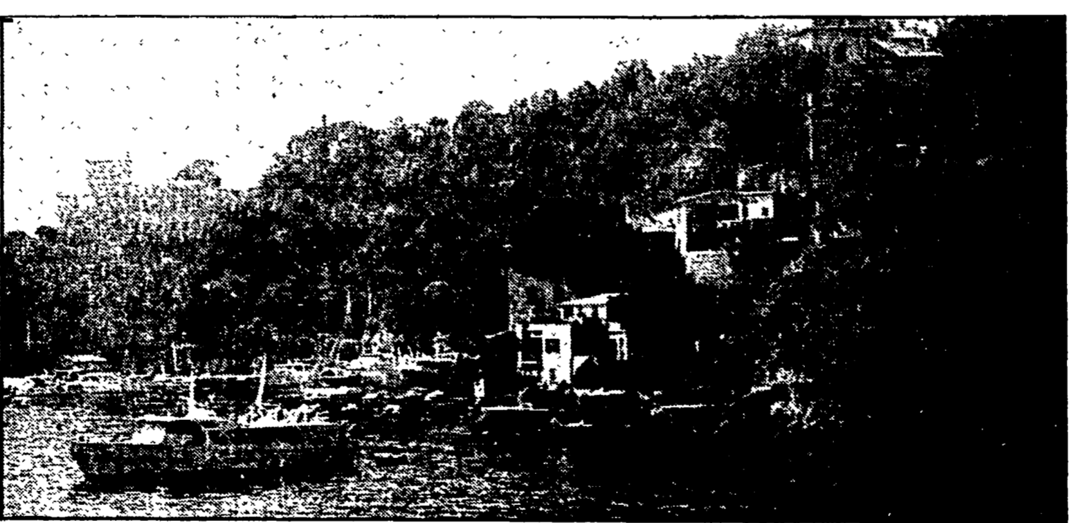
Una suggestiva veduta del golfo di Portofino

Il provvedimento salvato in consiglio regionale dalle opposizioni (Pci, Verdi, Dp)