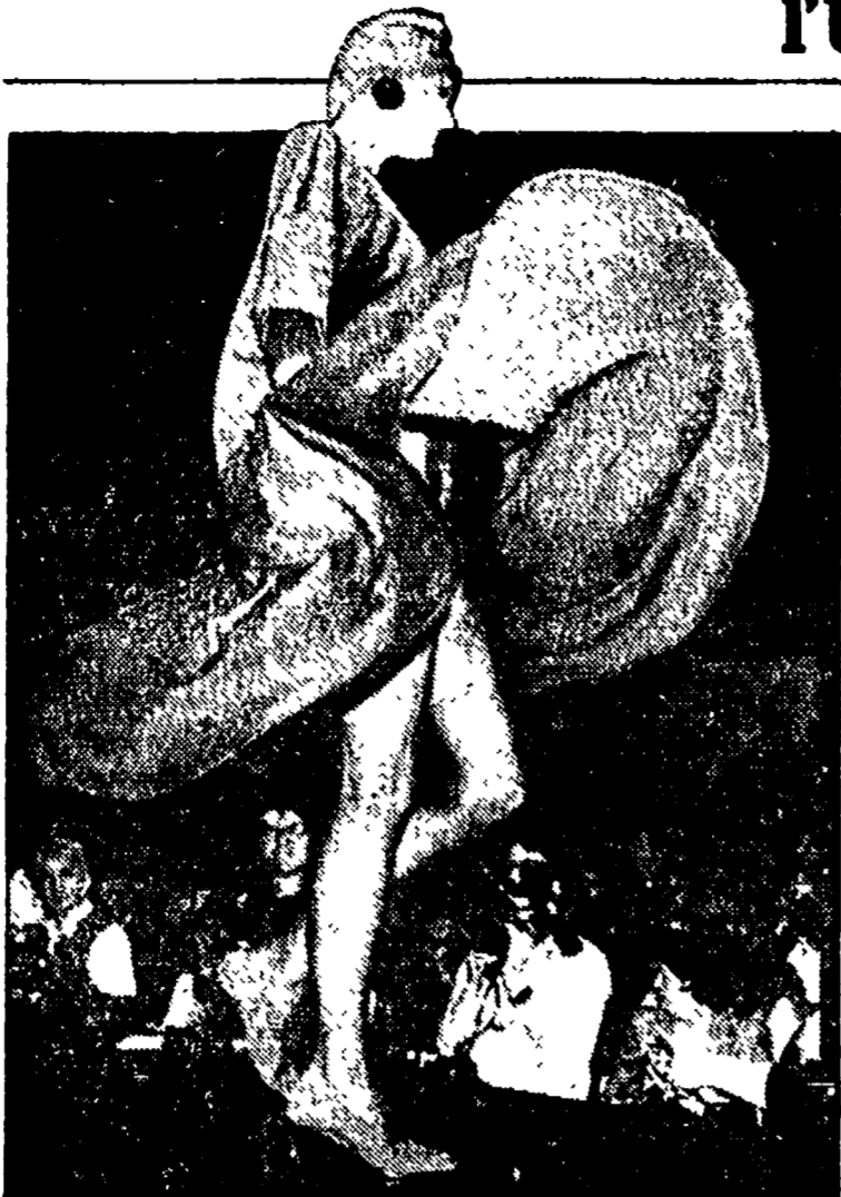
Un modello della collezione Missoni 1986