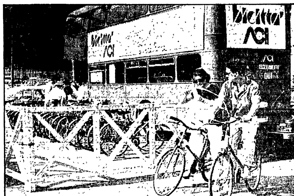
Il moderno bus a due piani dove si noleggiavano biciclette

Per gli amanti delle ore piccole c'è un'offerta «ad hoc», bicinotte a seimila lire con riconsegna l'indomani alle dieci. Sconti anche per i fedelissimi di Massenzio. Dal 24 luglio al 13 agosto tariffe del 25% in meno a chi mostra il biglietto d'entrata alla rassegna cinematografica. I noleggiatori di piazza del Popolo terranno l'insegna accesa fino alle due. Turisti e pedalatori in giacca e cravatta sono mosche bianche qualche centinaio di metri più in là. Scudito davanti all'antico