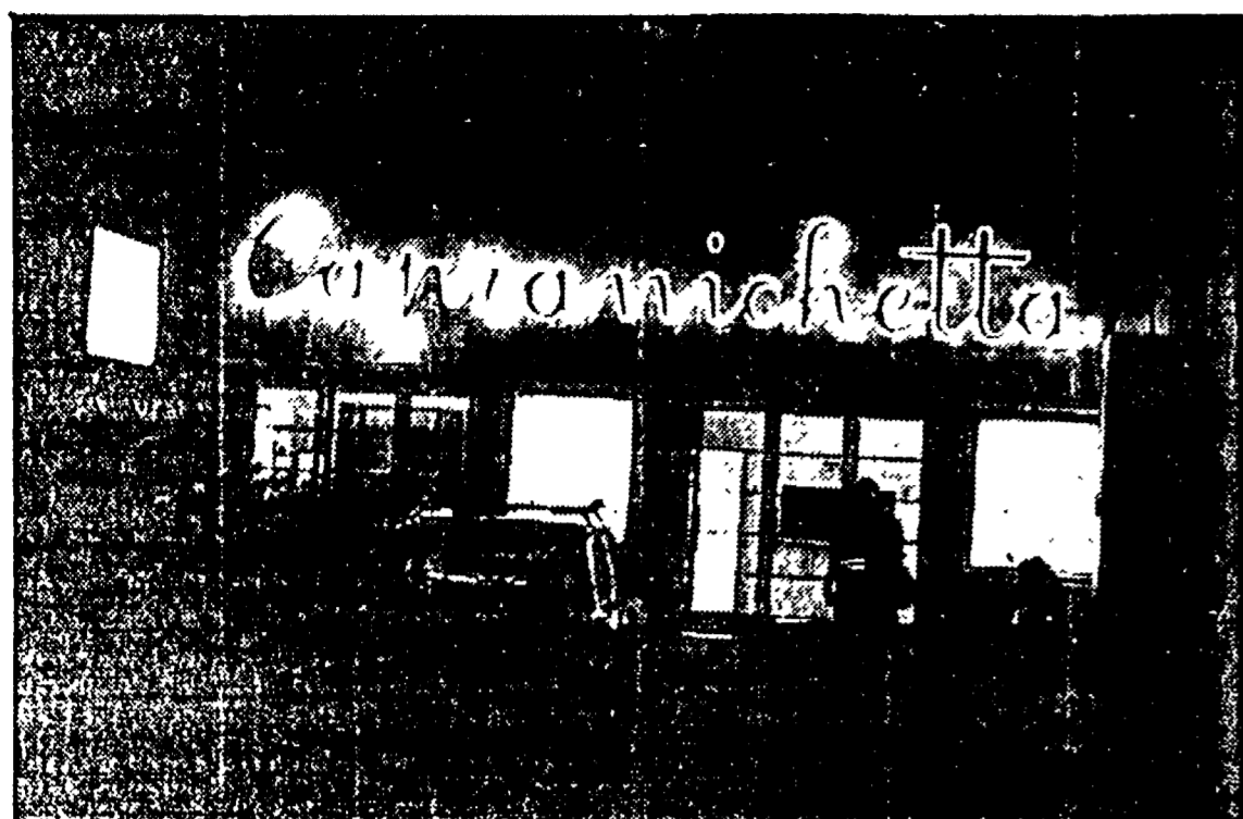
«Capranichetta», uno dei sei cinema che ospitano la rassegna Massenzio X