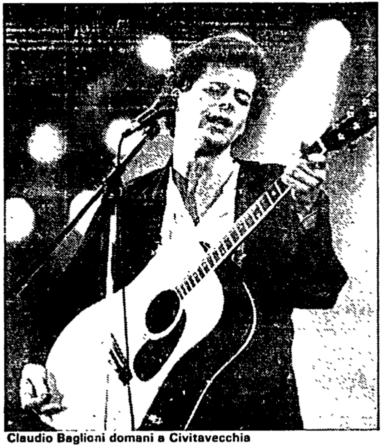
Claudio Baglioni domani a Civitavecchia

Bettini segretario Federazione romana Pci, 21,30 ballo iscio con i «Fedeli», 22 piano bar e discoteca. ● PRIMA PORTA (Case popolari, 5° lotto) — Ore 10 manifestazioni sportive: 17 giochi: intrattenimenti e premiazione tornei; 20 comizio di chiusura di Ugo Vetere, del Comitato centrale Pci; 20,30 serata dedicata al Nicaragua in collaborazione con Italia-Nicaragua e il Centro «Marianella Garcia», 21,30 musica romana con «I menestrelli di Roma», 23,30 estrazione della sottoscrizione a premi. ● OSTIA CENTRO (Pinetina) — Alle ore 19 dibattito conclusivo con il compagno Gianni Borgna del Comitato centrale del Pci. ● CIVITAVECCHIA — Oggi: Teatro Tenda, Circo Montecarlo, Spazio cinema: ore 21 dibattito sul nucleare con Niki Vendola della segreteria nazionale della Fgci e proiezione del film «Silkwood». Sport: ore 9 cicloraduno Civitavecchia-Tarquinia; «Passaggiata tra le colline degli etruschi». Domani: Teatro tenda, ore 21 spettacolo di danza classica e moderna, 22,30 «Lsdas» in concerto. Spazio cinema: ore 21 «Carosello» di Walt Disney (seconda parte), ore 22 «Lsdas», 23,30 film: «Lsdas». Domani: ore 21,30 Claudio Baglioni in concerto.