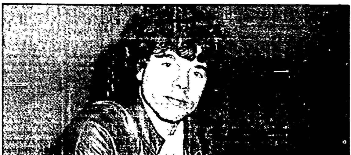
Riccardo Cocciante domani sera in concerto a Monterotondo

● ESTATE ERETINA — La manifestazione organizzata dal Comune di Monterotondo e dall'Arca ha in programma domani sera