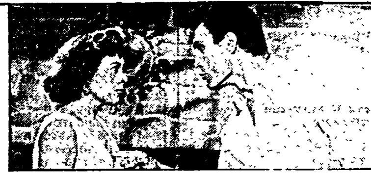
«Il grande coltello» (Telemontecarlo, ore 19,45)