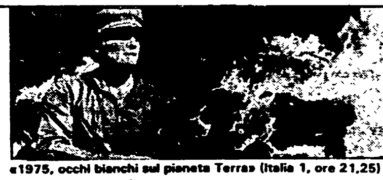
«1975, occhi bianchi sul pianeta Terra» (Italia 1, ore 21,25)