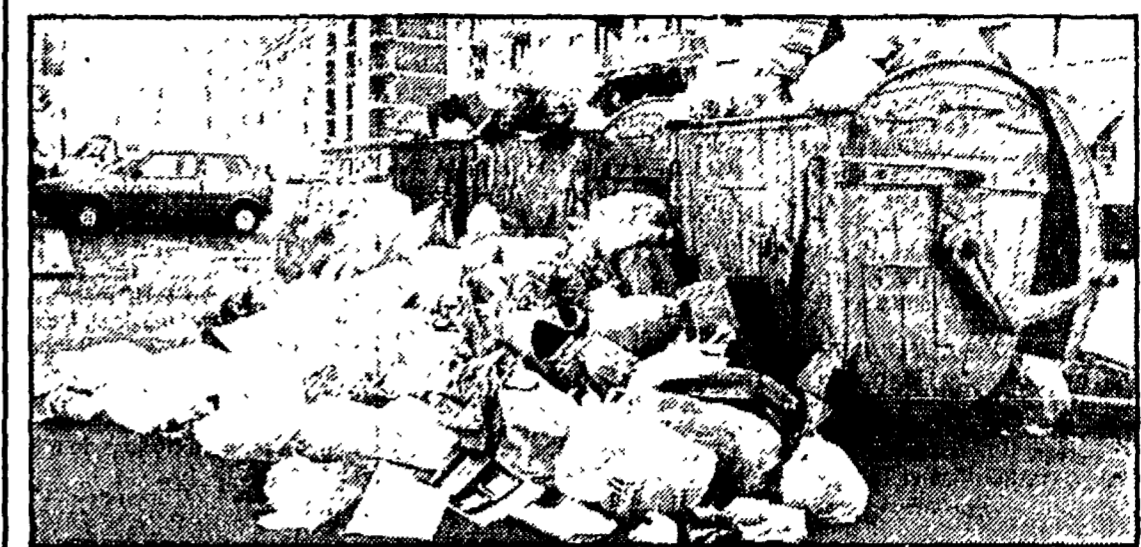
Roma nel caos, i cassonetti ricolmi di spazzatura